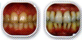
بعد از درمان